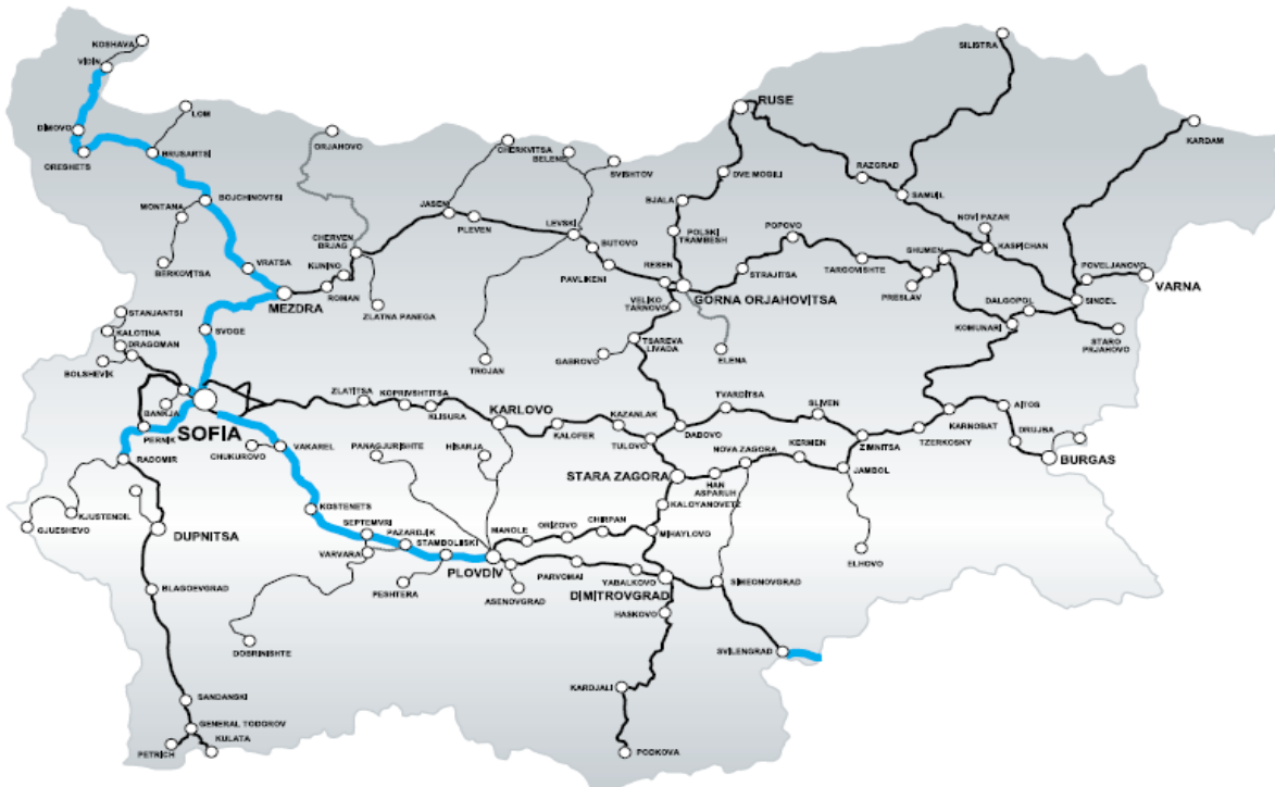
Фигура 1, Инфраструктурни проекти по модернизация на железопътната инфраструктура 2007-2013