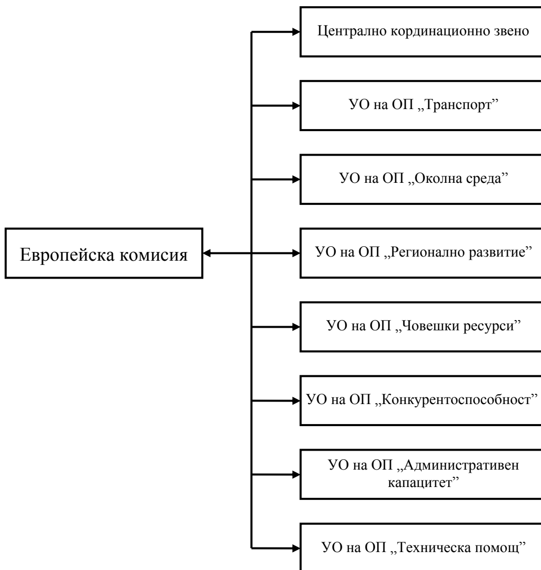
Фигура 2, Взаимодействия между ЕК и отговорните за изпълнението на оперативните програми Управляващи органи

получава цялата необходима информация за процедурите и проверките, извършени във връзка с разходите, с цел сертифицирането им;