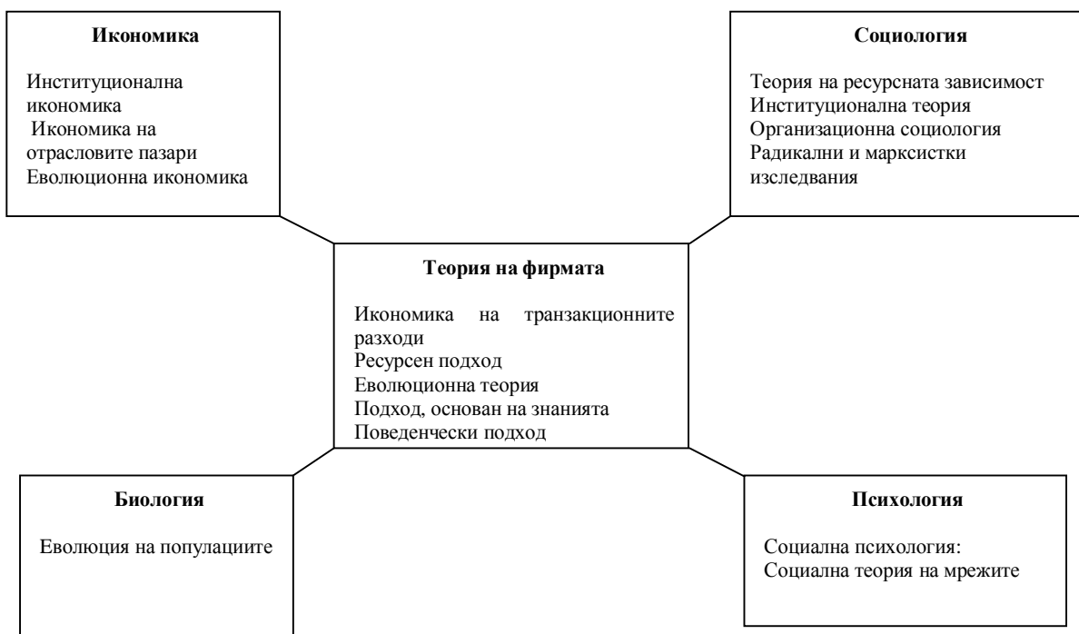
Фиг. 1 Комплексно изследване на междуфирмената кооперация

принос за формирането на съвременната мрежова парадигма.